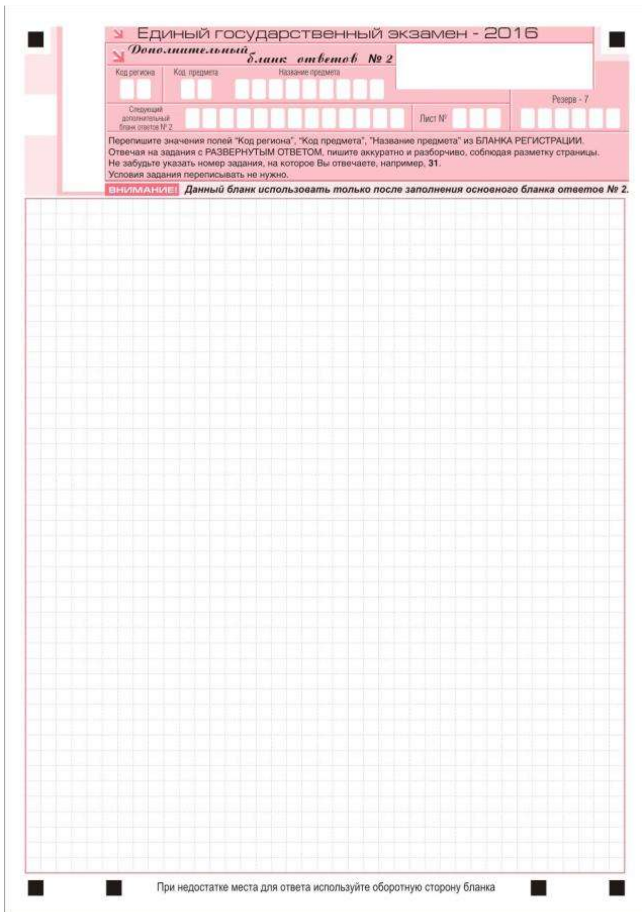
Рис. 11. Дополнительный бланк ответов № 2