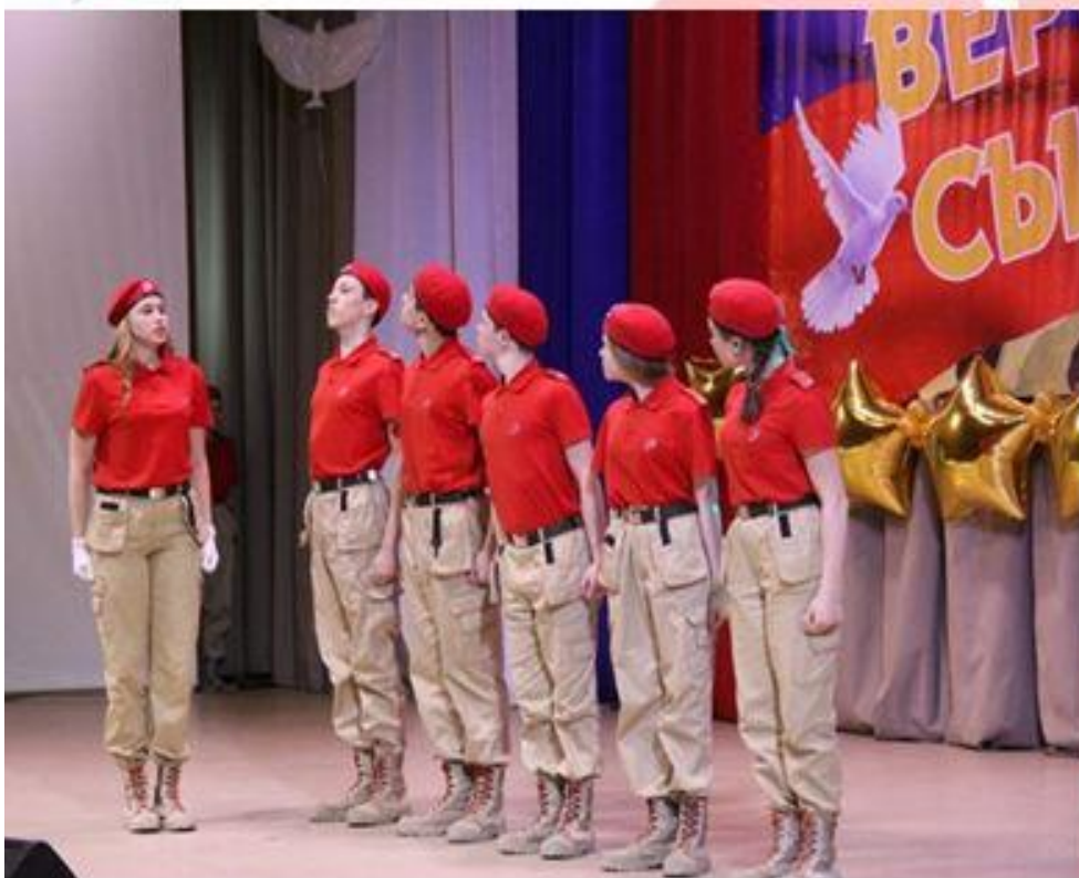
10.05.2018. Закрытие фестиваля «Отчизны верные сыны»*