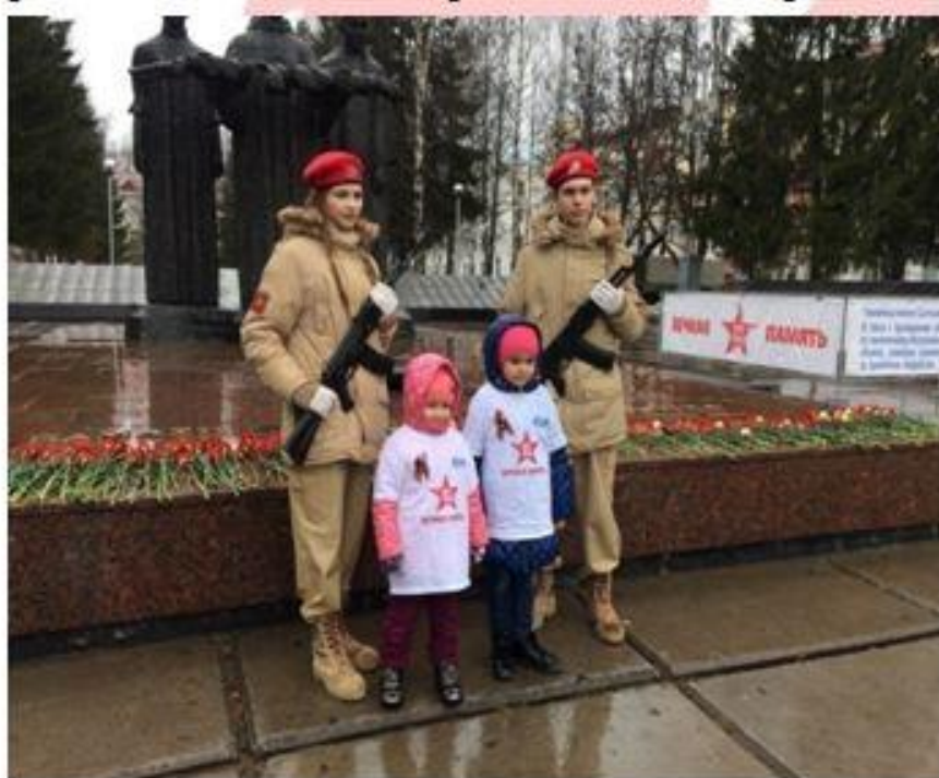
27.04.2018. Акция «Огонь памяти».

10 мая знаменная группа юнармейцев 21 школы завершила городскую акцию «Знамя Победы» в 2017\2018 учебном году, торжественно возвратив копию Знамени Победы представителям ветеранских организаций.