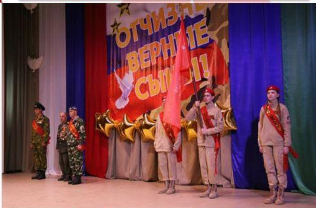
10.05.2018. Городская акция «Знамя Победы»*

27 сентября 2018 г. юнармейцы 21 школы совершили выезд в с. Сторожевск Корткеросского района для организации и проведения площадки «Юнармия» в рамках IV Республиканской акции «Патриотический десант «Город – селу».