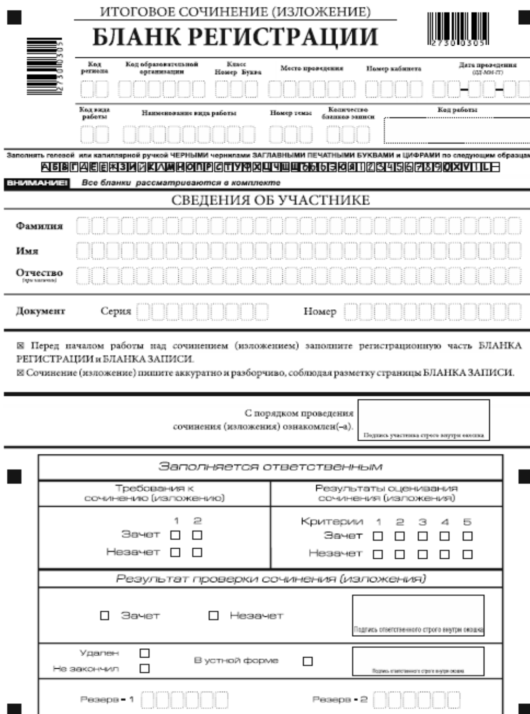
Рис. 1. Бланк регистрации

Бланк регистрации (рис. 1) состоит из трех частей: верхней, средней и нижней.