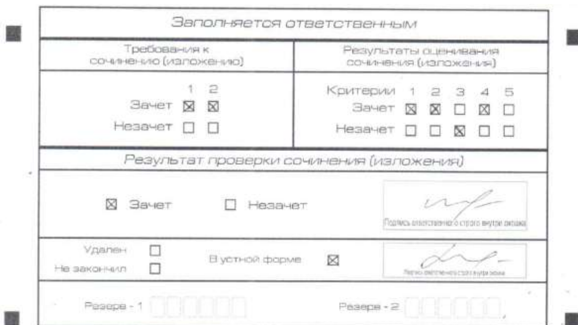
Рис. 9. Область для оценки работы сочинения (изложения) в устной форме

После окончания заполнения бланка регистрации ответственное лицо ставит свою подпись в специально отведенном для этого поле.