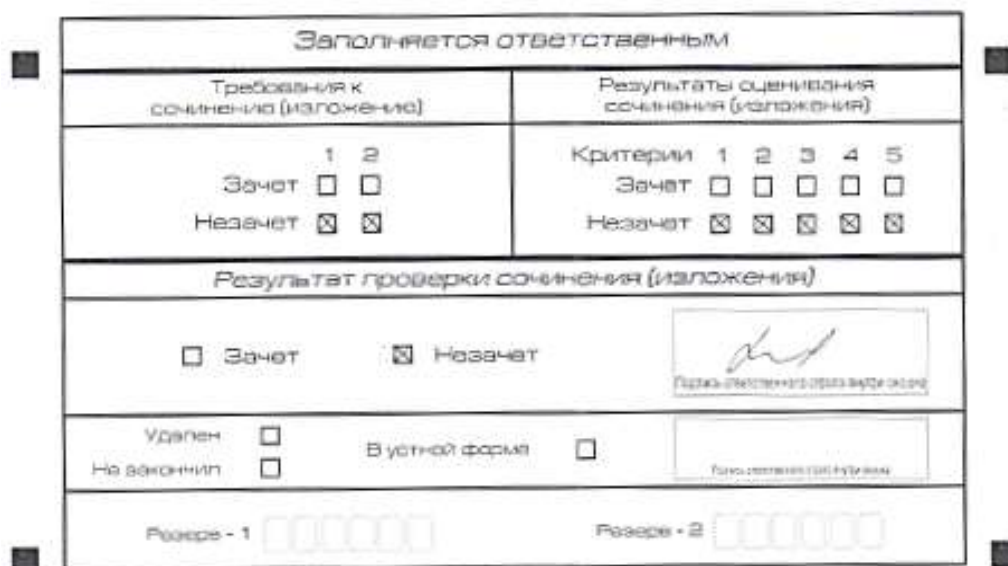
Рис. 7. Область для оценки работы

Если в копии бланка регистрации стоит «незачет» за невыполнение требования № 2, то в клетки по всем критериям оценивания выставляется «незачет». В поле «Результат проверки сочинения (изложения)» ставится «незачет».